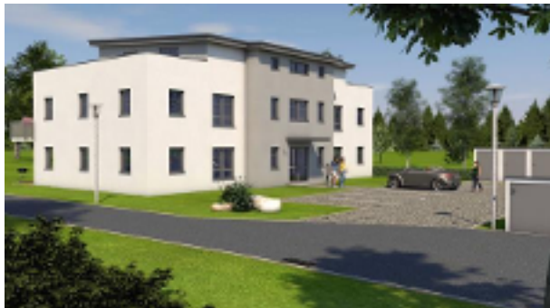
Vorderansicht mit Stellplätzen