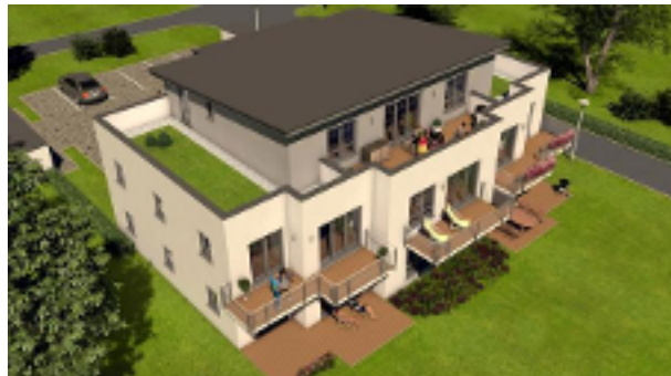
Grosszügige Balkone und Terrassen